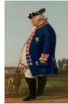
de 'Dikke Hertog'

salons van het paleis loopt, kruipt je als het ware in de huid van de Dikke Hertog: de kroonluchters, de stof op de wanden, de eikenhouten vloer, het ziet er allemaal net zo uit als in de 18 e eeuw. Als je er ook muzikanten met pruiken bij denkt, zie je precies hoe een feest in een salon er uit zag in de Tijd van pruiken en revoluties.