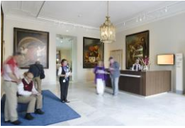
Garderobe links af

De ingang van het museum bevindt zich in het voormalige paleis van de gouverneur van Brabant. Zo werd de Commissaris van de Koningin eind 18 de eeuw genoemd. Lodewijk Ernst van Brunswijk-Wolfenbüttel-Bevern, oftewel 'de Dikke Hertog', was verantwoordelijk voor het bestuur van de provincie Noord-Brabant. Niet gek natuurlijk dat dit gebouw in de hoofdstad van de provincie staat: 's-Hertogenbosch oftewel Den Bosch. Als je door de