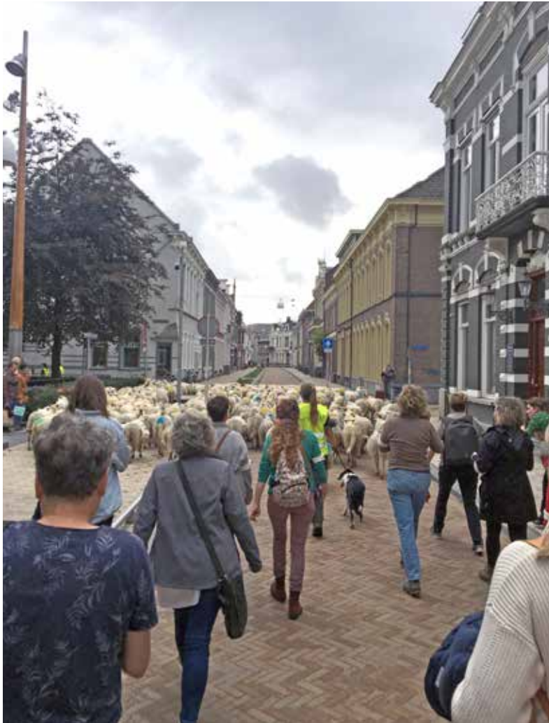
Cynthia Hathaway Wool March, 2022 Video, 3:51 min