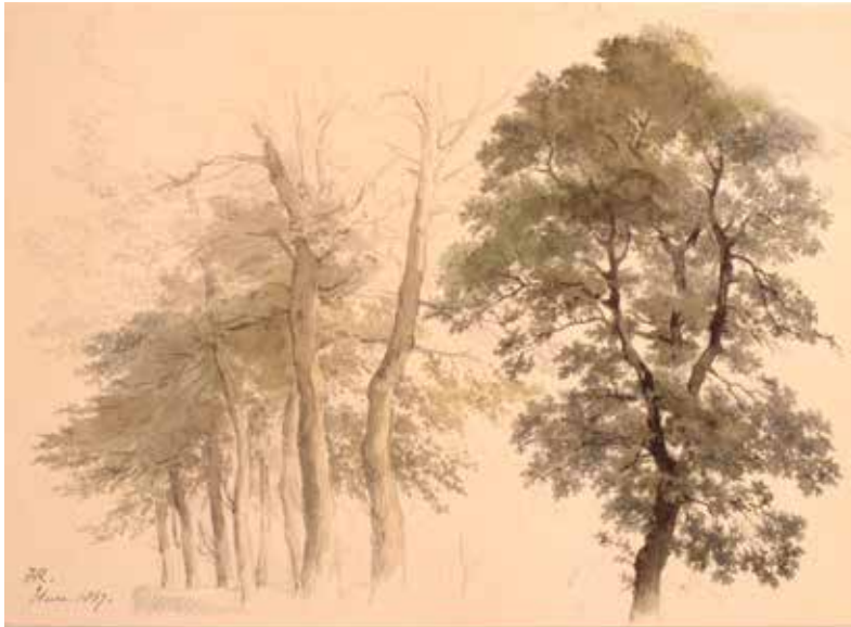
Henriëtte Ronner-Knip (1821-1909) Boomstudie bij Heeze, 1837 Waterverf op papier, 28 x 38 cm Collectie Het Noordbrabants Museum

Henriëtte Ronner-Knip was 16 years old when she made this study near Heeze. She observed nature very closely. She drew this tree without idealizing it. In the 19th century, many artists set out to work in nature. They went in search of picturesque places or the uniqueness of their surroundings. Born into a family of artists, Ronner-Knip was observant from an early age. Her childhood drawings, also included in the exhibition, bear witness to this.