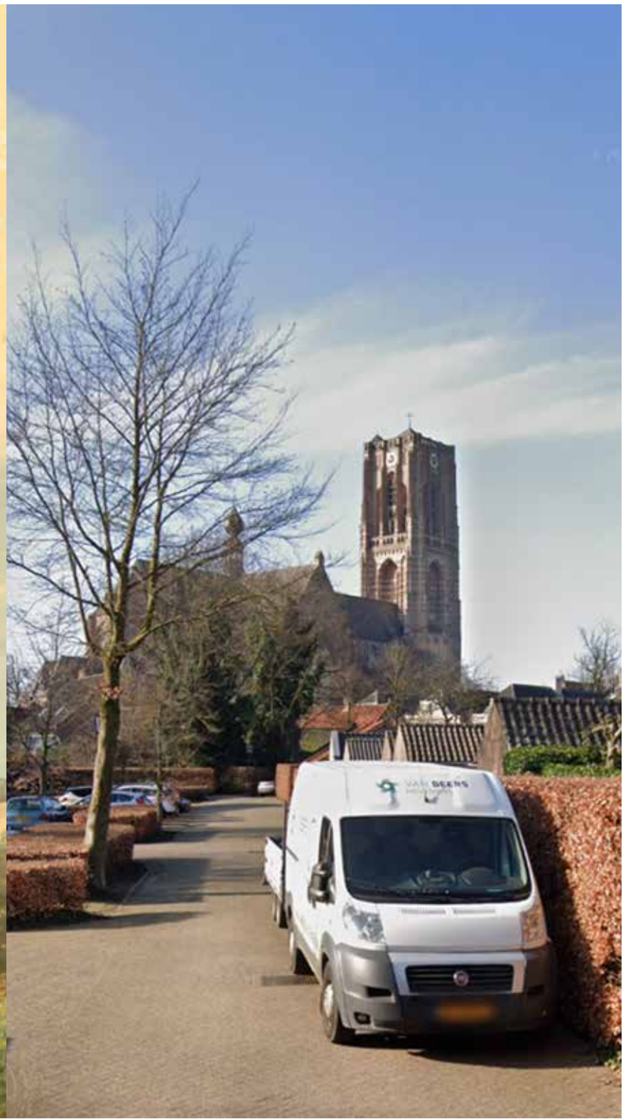
Gasthuisstraat, Oirschot , 2016