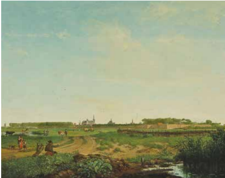
Jacobus Vrijmoet (geboren 1756) Gezicht op de vesting 's-Hertogenbosch vanuit het noorden, 1785 Olieverf op paneel, 47 x 60 cm Collectie Het Noordbrabants Museum