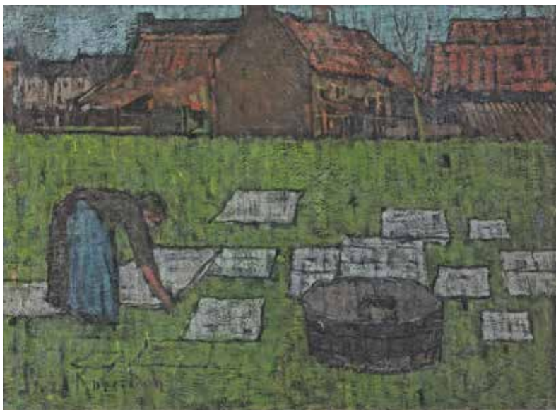
Suze Robertson (1855-1922) Bleekveld , ca. 1895-1898 Olieverf op doek, 57 x 77 cm Particuliere collectie