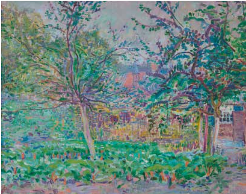
Jan Sluijters (1881-1957) Boomgaard te Heeze, 1909 Olieverf op doek, 48 x 60 cm Collectie Het Noordbrabants Museum. Verworven met steun van de Provincie Noord-Brabant