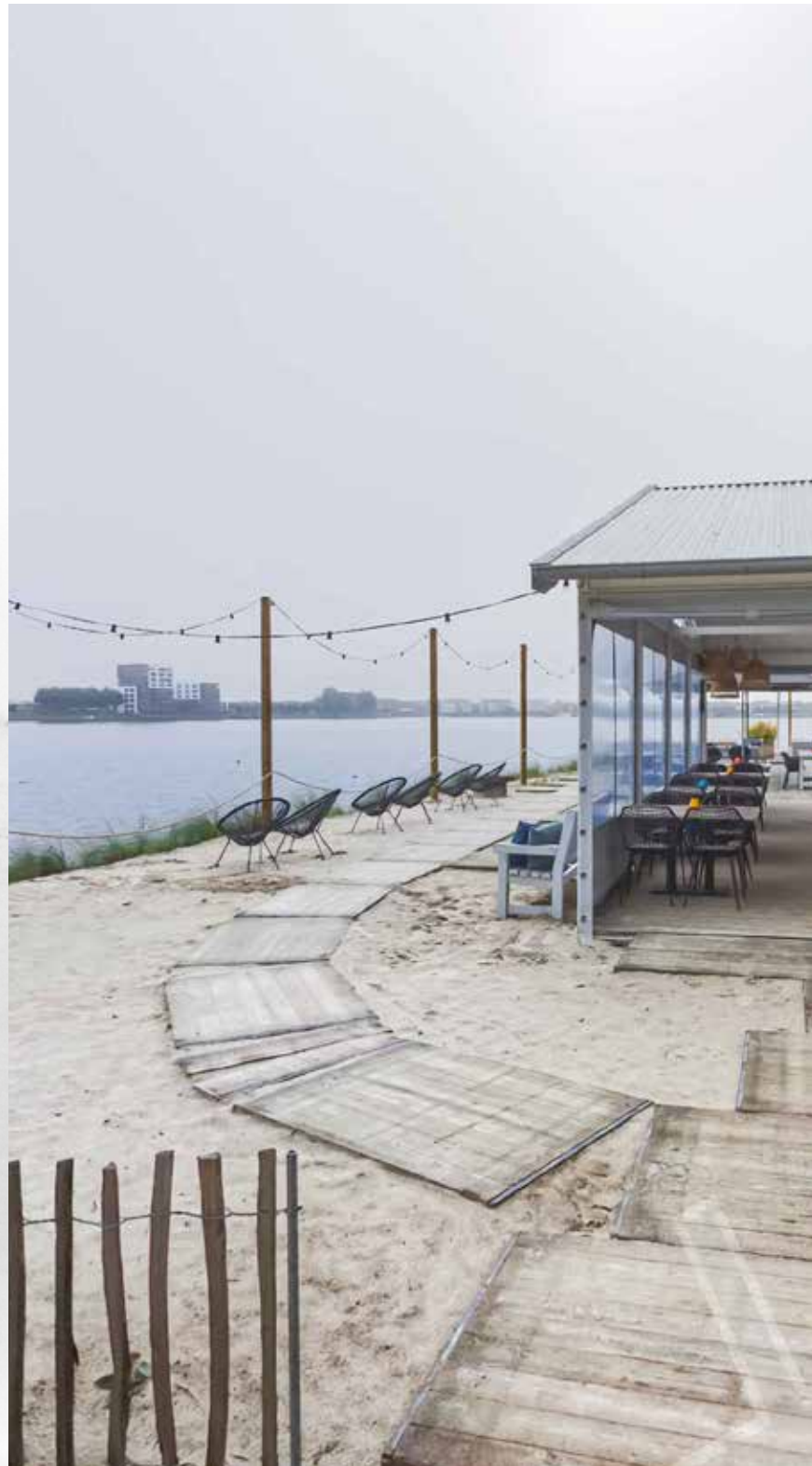
GO 360, Strandpaviljoen évive aan het water, Kraaijenbergse Plassen / Beachpavilion évive aan het water, 2021