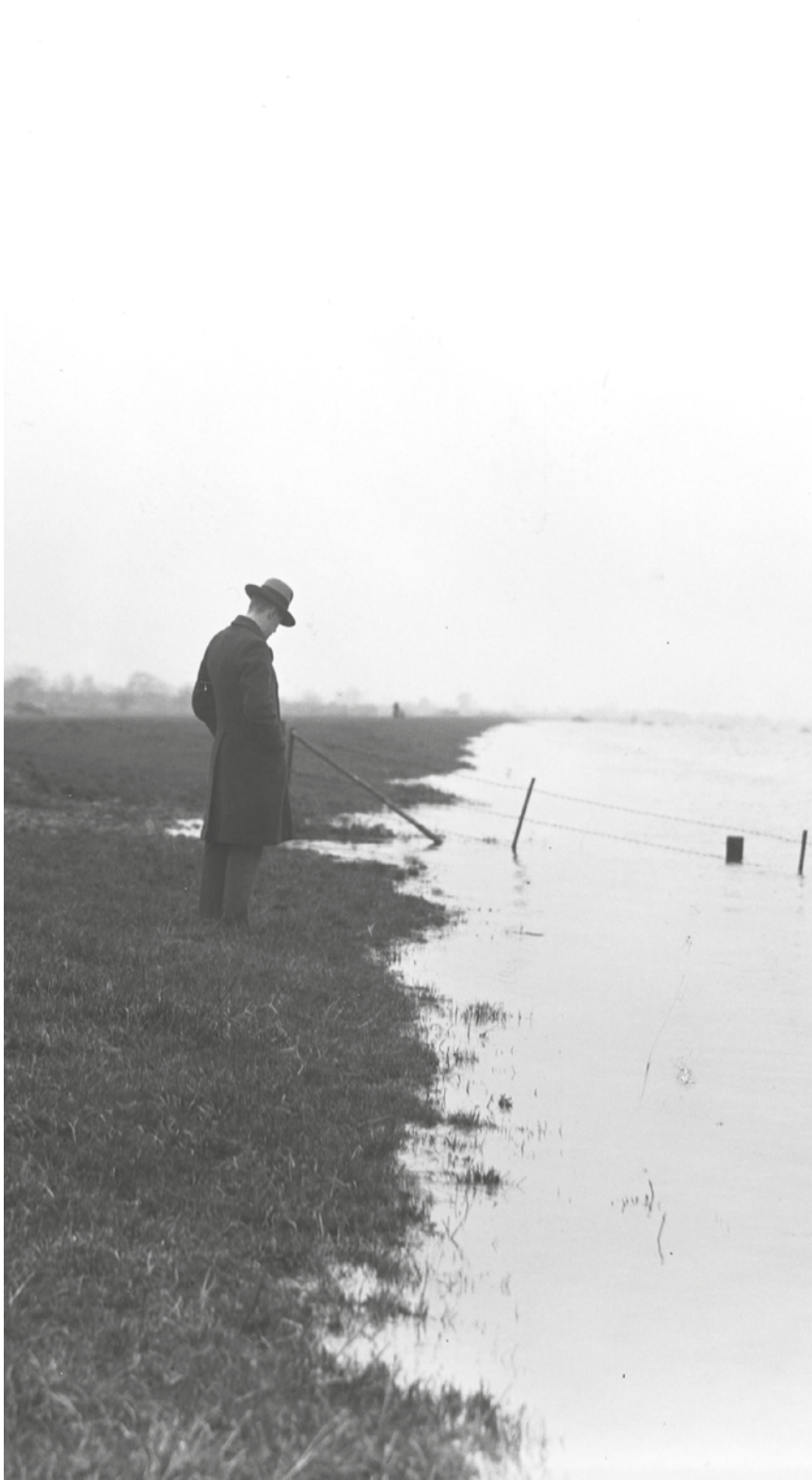
Fotopersbureau Het Zuiden / Photo agency Het Zuiden, Watersnood, de Maas zet grote stroken land onder water, De Beersche Overlaat / Inundation, the Maas Floods Large Areas of Land in the Beersche Overlaat, 1932 Brabants Historisch Informatie Centrum (BHIC) (detail)