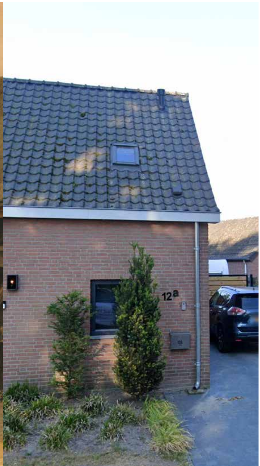
Griendtsveenseweg, Deurne, Noord-Brabant