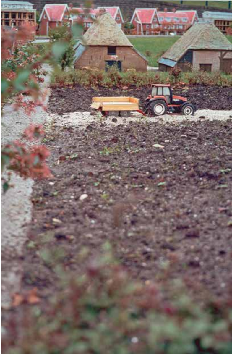
Eva Leitolf (1966) Madurodam: Brabantse boerderij Liempde, 1999 Foto, 92 x 62 cm Rijksmuseum. Aankoop met steun van het NRC Handelsblad