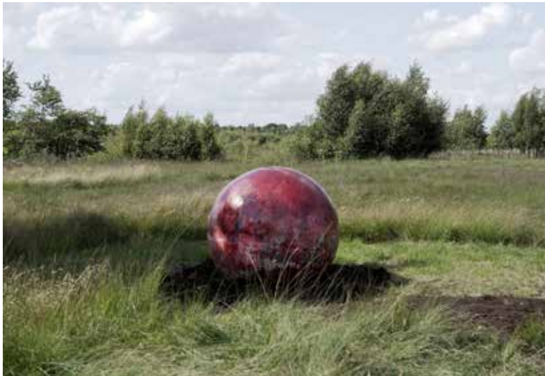
Semâ Bekirović (1977) All that is solid , 2024 Video, 11:59 min