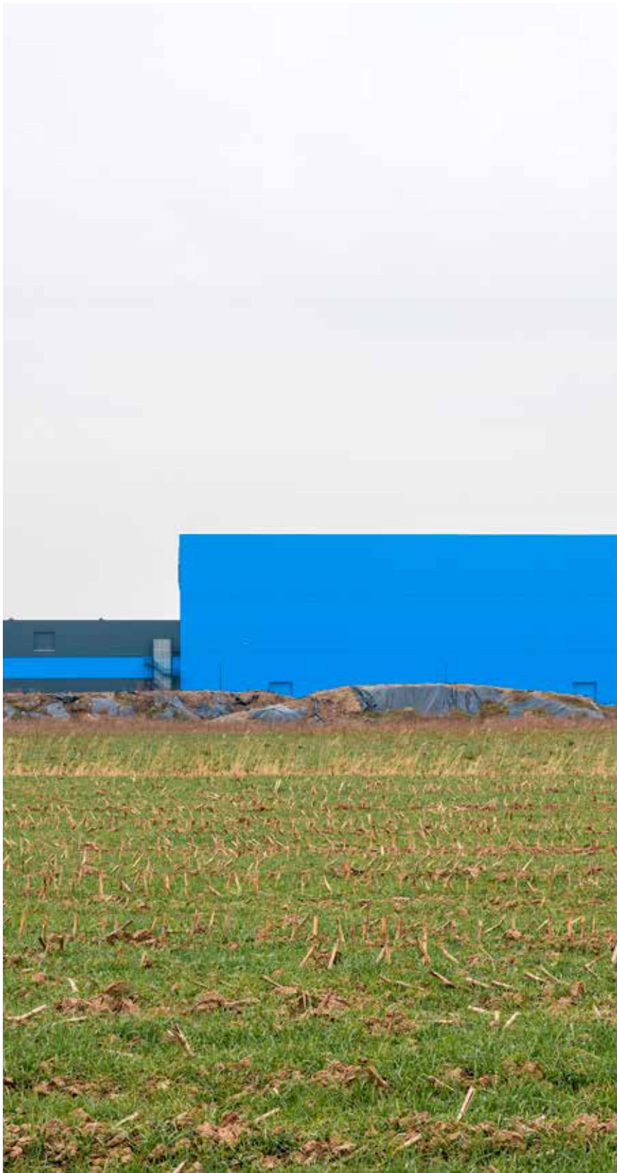
Paul Swagerman, Bol.com distributiecentrum / distribution center, Waalwijk, Nederland / the Netherlands , 2021 (detail)