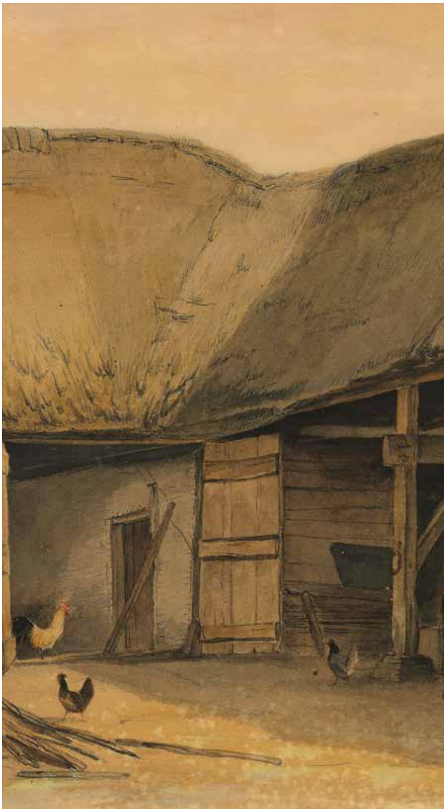
Henriëtte Ronner-Knip (1821-1909), Boerderij te Berlicum / Farm in Berlicum , 1846, Collectie Museum Jan Cunen. Aangekocht met de steun van de Provincie Noord-Brabant en de Gemeente Oss (detail)