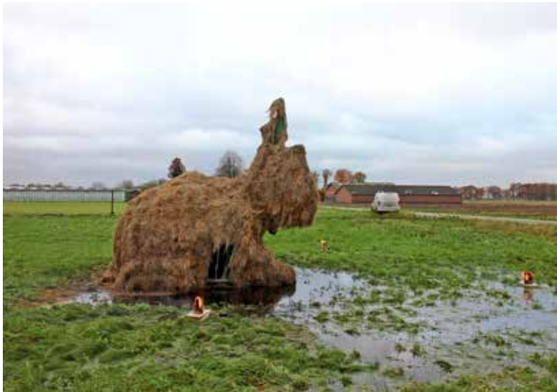
Erik van Lieshout (1968) De Gloeiige , 2024 HD video, kleur, geluid, 60 min Collectie Het Noordbrabants Museum, mede mogelijk gemaakt door Het Noordbrabants Museum, 's-Hertogenbosch en het Mondriaan Fonds