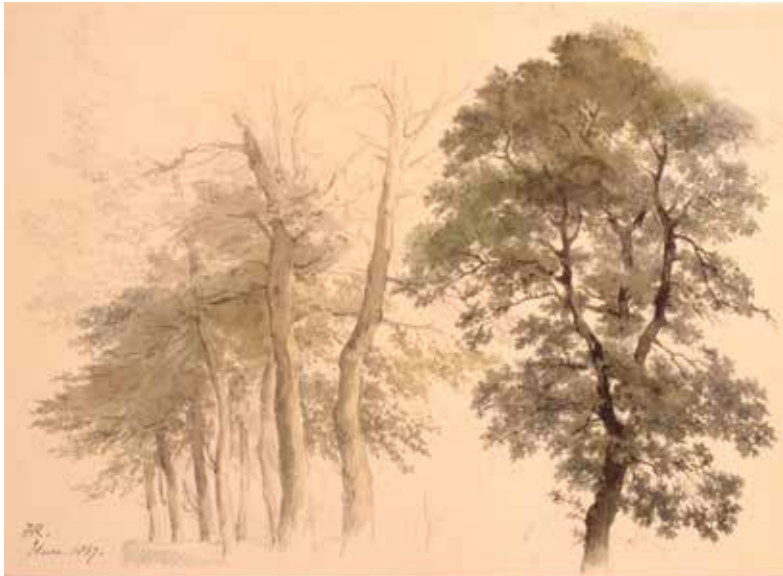
Henriëtte Ronner-Knip (1821-1909) Boomstudie bij Heeze, 1837 Waterverf op papier, 28 x 38 cm Collectie Het Noordbrabants Museum

Henriëtte Ronner-Knip was 16 years old when she made this study near Heeze. She observed nature very closely. She drew this tree without idealizing it. In the 19th century, many artists set out to work in nature. They went in search of picturesque places or the uniqueness of their surroundings. Born into a family of artists, Ronner-Knip was observant from an early age. Her childhood drawings, also included in the exhibition, bear witness to this.