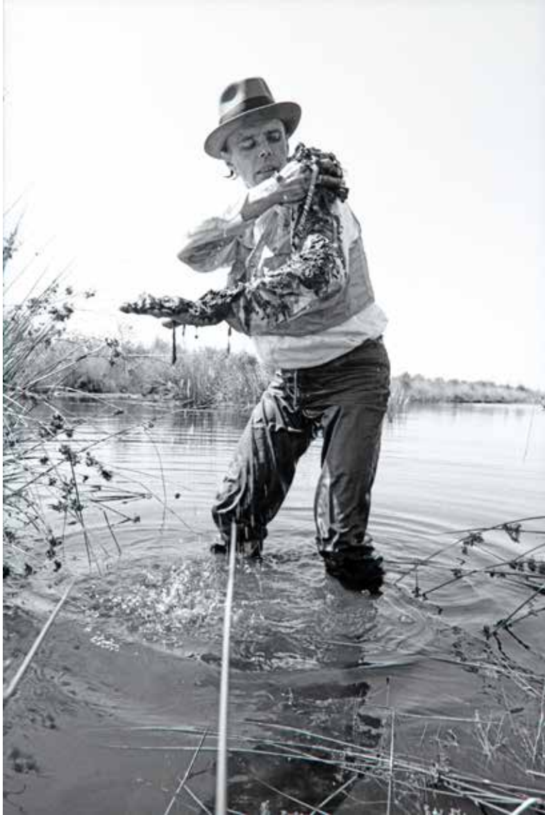
Gianfranco Gorgoni (1941-2019) Joseph Beuys 'Aktion im Moor', Eindhoven, 1971