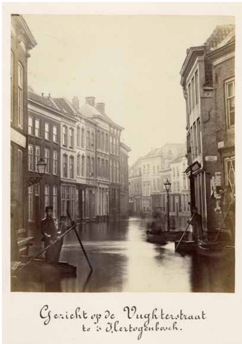
Anoniem Slachtoffers van een overstroming in Brabant, 1876 Foto, 24,6 x 34,1 cm (blad) Koninklijke Verzamelingen, Den Haag