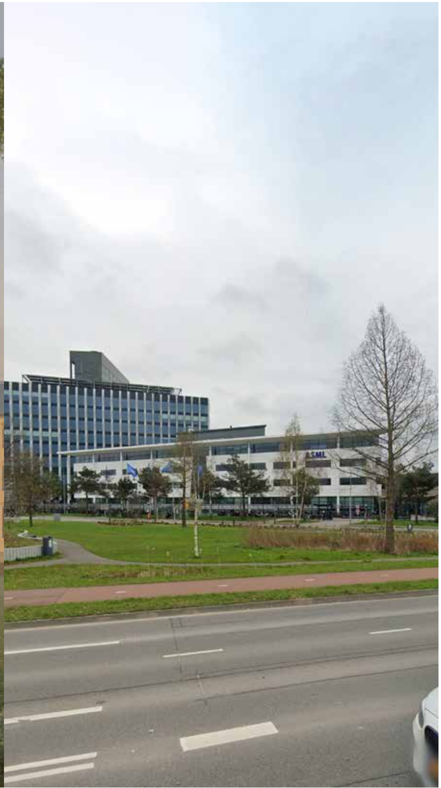
ASML Global HQ, Veldhoven, 2024