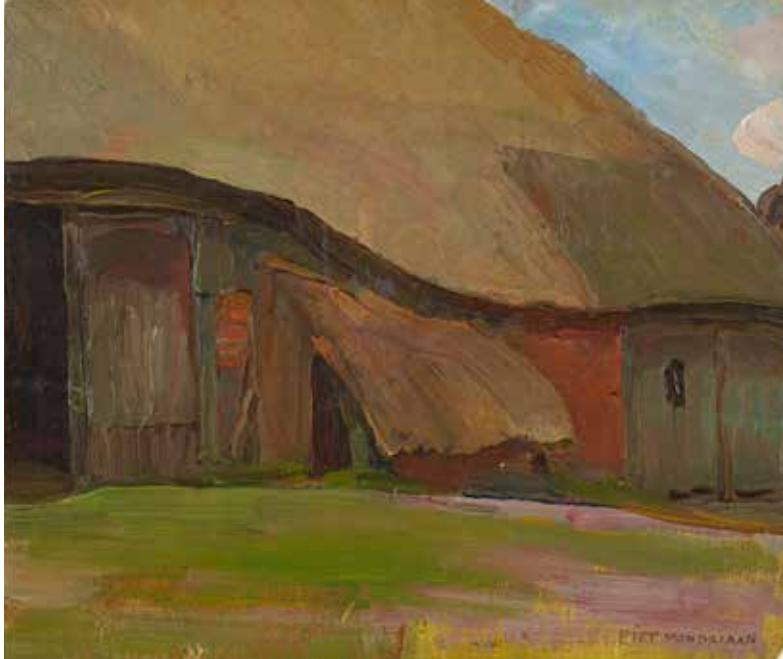
Piet Mondriaan (1872-1944) Boerderij, Brabant, 1904 Olieverf op papier op karton, 28,5 x 34 cm Kunstmuseum Den Haag