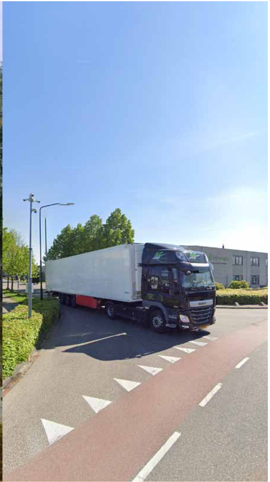
Industrieweg, Boxtel , 2022