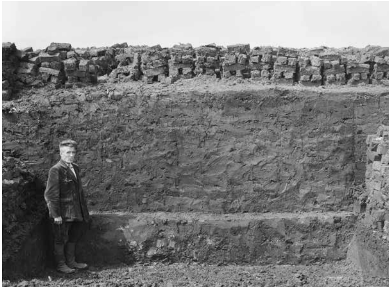
Anoniem Turfstekerij te Deurne, mid 20ste eeuw

‘Here he is, the digger, the cutter, rough and blindly loyal to the labour of his youth and young years. The peelwroeter.’ This is how novelist Antoon Coolen describes a peat cutter in Peelwerkers (1930). In the Peel, peat labourers would cut blocks of peat from the moorland in shifts. Peat extraction was hard work, but it cut both ways. The peat was used as fuel and the reclaimed landscape was transformed into agricultural land.